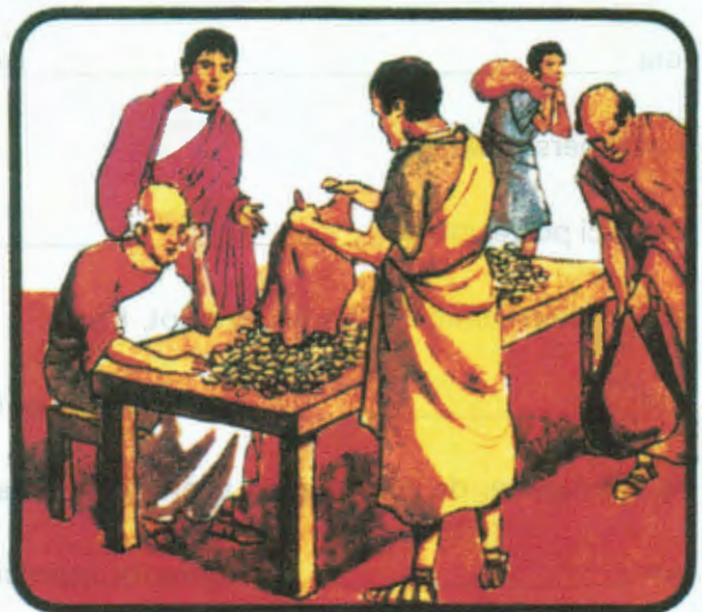
« Premières civilisations à la chute de Rome » Bibliothèque Rouge et Or, Editions G. P., Paris